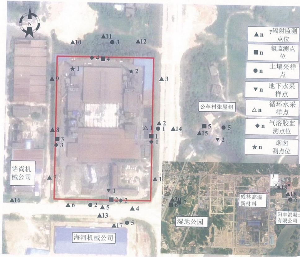
图 1 厂区周围环境辐射监测点位布置图